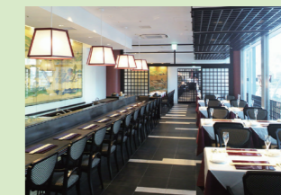
シックな調度品と落ち着いた茶園気の店内

入口から茶の香りで満たされる店内。宇治茶を使った創作茶懐石や本格的な宇治茶をお楽しみいただけます。おすすめはカウンター席。間近に呈茶の様子を見られる特等席です。