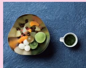
おすすめの抹茶あんみつ 1,400円。和と洋が交わった新しいスタイルです。