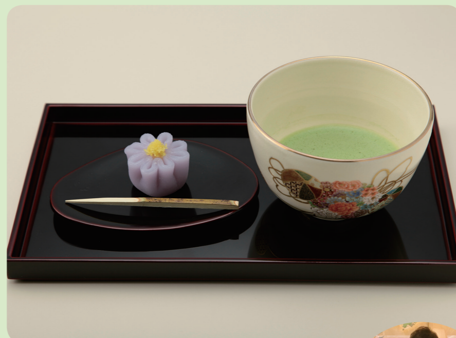
抹茶 飛泉 1,620円。よく泡立てた、まろやかな宇治抹茶をお楽しみください。