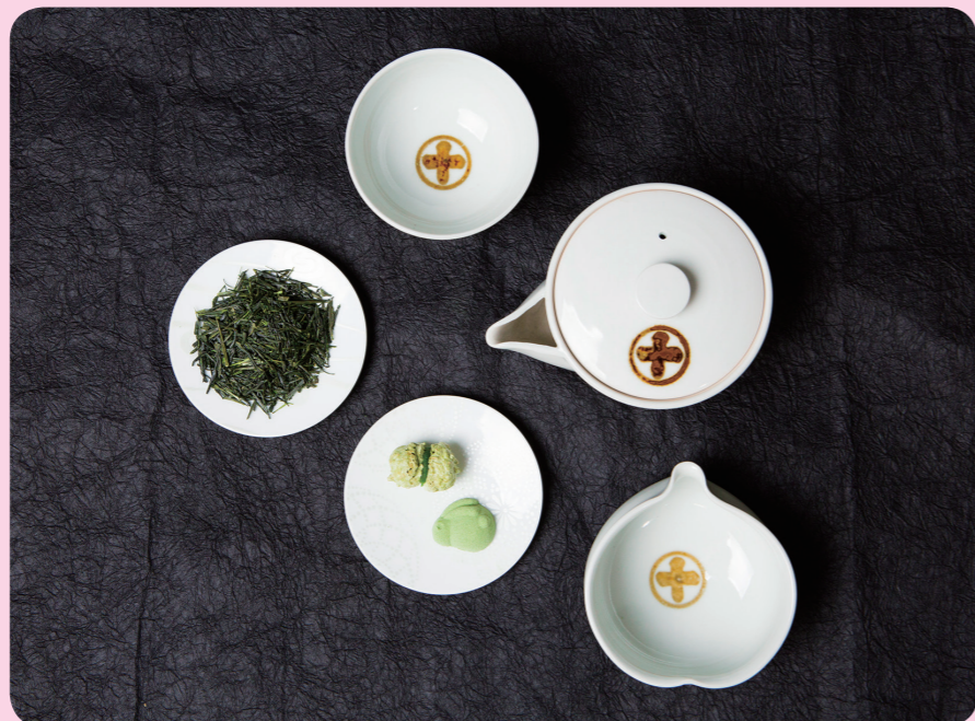
爽やかで透明感のある煎茶「典型」800円（全ての銘茶にお茶菓子付き）