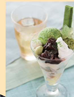
ふんだんに抹茶を使った「抹茶パフェ」800円