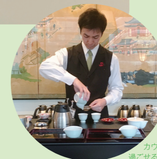
カウンター席では、茶を淹れる所作を眺めながら過ごせるのも魅力。

宇治茶サロン~日本茶教室~ (お食事付き、なしのプランあり) 希望日の 10 日前までに電話予約