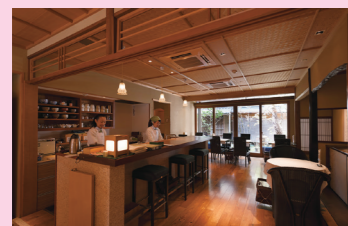
上質な宇治茶を丁寧にお淹れしております