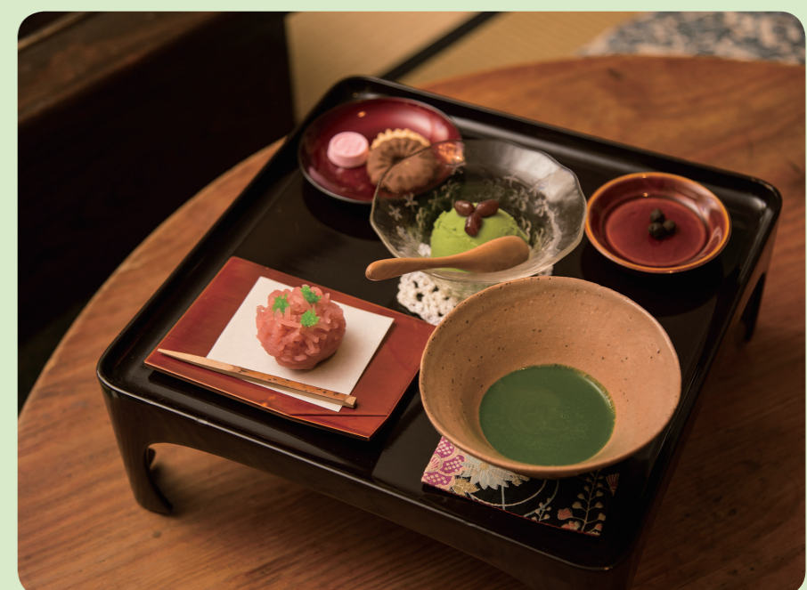
京都市内ではあまり見かけない、濃茶を楽しめる贅沢なお茶セット 1,860円