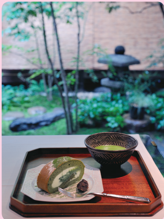
洋スイーツ派におすすめしたい抹茶のロールケーキセット 1,200円