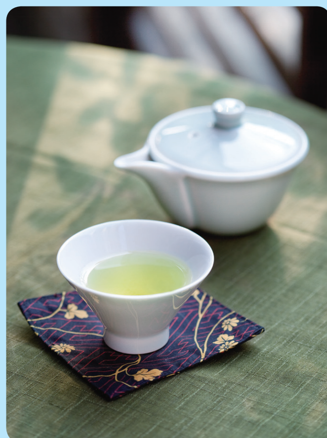
さまざまな茶種をご用意しています。