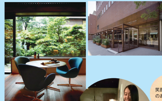
笑顔で心からのおもてなし