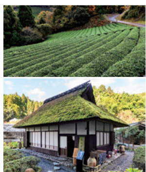
永谷宗円生家 (詳細はヒストリーのページにて)