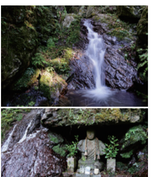
大滝に祀られたお不動さん