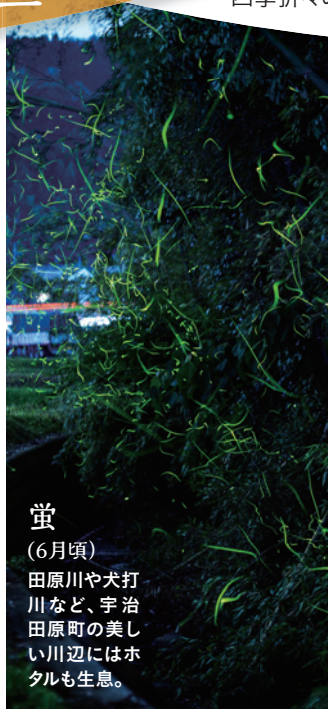
蛍 (6月頃) 田原川や犬打川など、宇治田原町の美しい川辺にはホタルも生息。