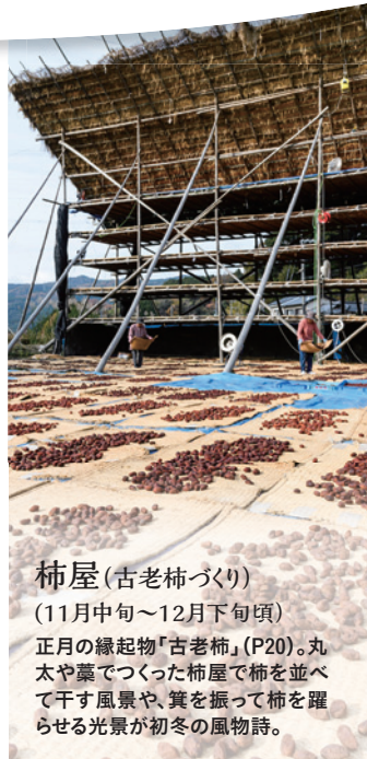
柿屋 (古老柿づくり) (11月中旬～12月下旬頃) 正月の縁起物「古老柿」(P20)。丸太や藁でつくった柿屋で柿を並べて干す風景や、箕を振って柿を躍らせる光景が初冬の風物詩。