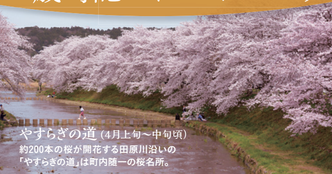
やすらぎの道 (4月上旬～中旬頃) 約200本の桜が開花する田原川沿いの「やすらぎの道」は町内随一の桜名所。