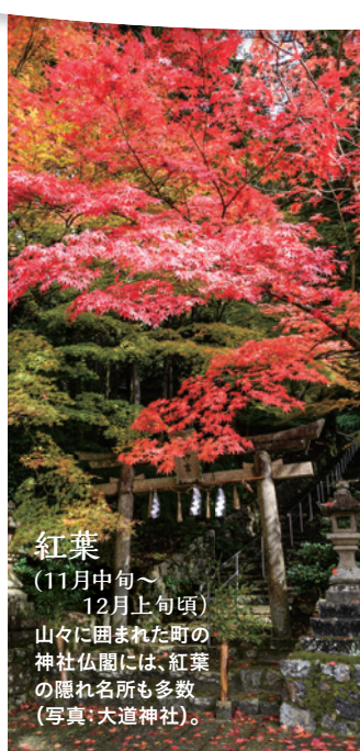
紅葉 (11月中旬～12月上旬頃) 山々に囲まれた町の神社仏閣には、紅葉の隠れ名所も多数。