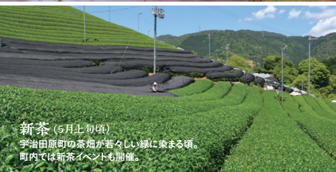
新茶 (5月上旬頃) 宇治田原町の茶畑が若々しい緑に染まる頃。町内では新茶イベントも開催。