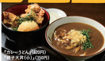
『カレーうどん』(620円) 『親子天丼(小)』(350円)