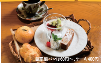
自家製パンは60円〜、ケーキ400円