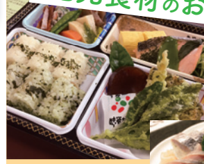
※弁当の内容は季節や価格により異なります