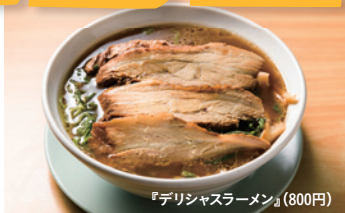
『デリシャスラーメン』(800円)