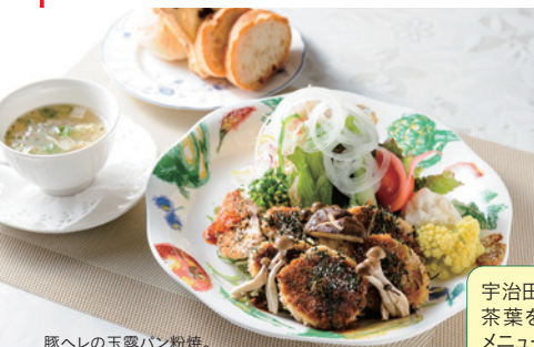
豚へれの玉露パン粉焼。 地元野菜もたっぷり使用。