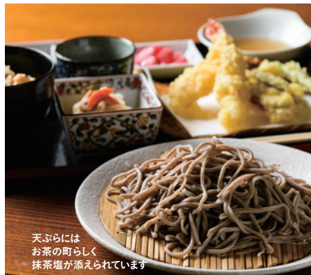
天ぷらにはお茶の町らしく抹茶塩が添えられています