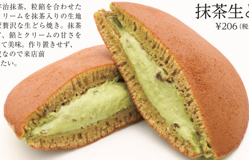
抹茶生どら ¥206 (税込)

高級宇治抹茶、粒餡を合わせた特製生クリームを抹茶入りの生地で挟んだ贅沢な生どら焼き。抹茶が濃くて、餡とクリームの甘さを引き立てて美味。作り置きせず、個数限定なので来店前に確認したい。