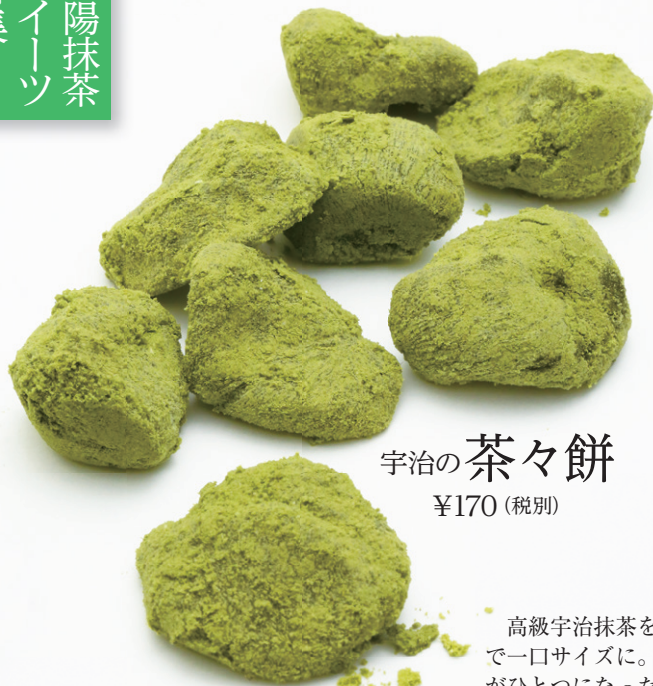
宇治の茶々餅 ¥170 (税別)

高級宇治抹茶を練り込んだ餅で、小豆餡を包んで一口サイズに。きなこの香ばしさと抹茶の旨味がひとつになった粉が贅沢にかかっている。全国菓子大博覧会で中小企業庁長官賞を受賞した銘菓。