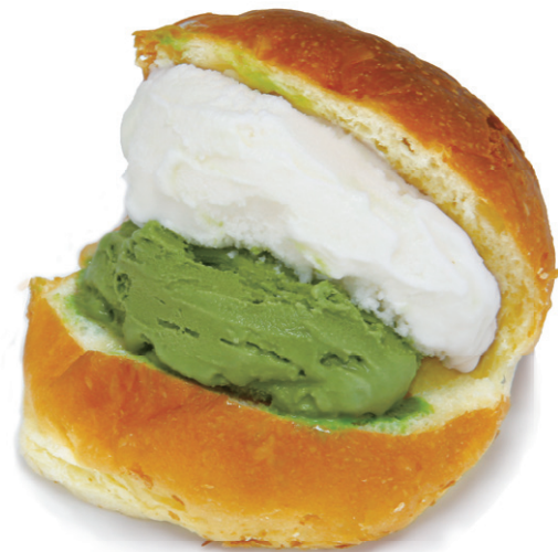
ブリオッシュ コン ジェラート シングル¥486 (税込) ダブル¥702 (税込)

おうす(抹茶)、ミルク、キャラメル、ラズベリーなどの手作りジェラートを温かいブリオッシュで挟んで楽しむ。抹茶は人気でシングルかパナラとのダブルがおすすめ。パン生地が美味しいのもベーカリーならではの。