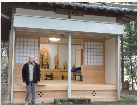
現建物は平成22年8月26日上棟 平成23年1月2日落慶法要

このお寺を知らしめているのは、京都府文化財に指定されている〈大般若経〉であり、東明寺には、588帖が伝存しており、大正12年に内38帖が奈良国立博物館に、残りの550帖は飛鳥路の人々に守られ東明寺で保存されていたが、のちに京都府立山城郷土資料館へ寄託された。