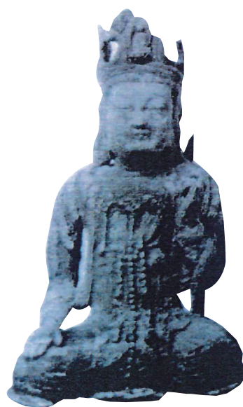
(火災、像の製作された時代は不明)