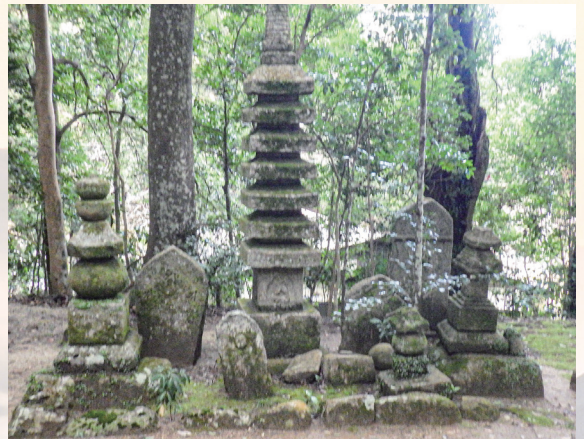
東明寺 石造物全景