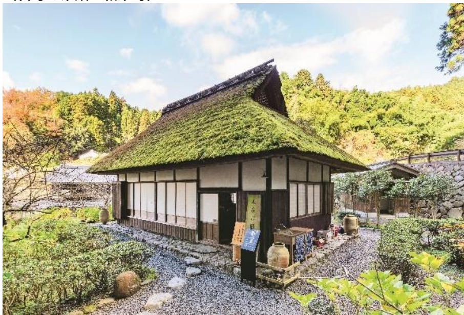
(永谷宗円生家 宇治田原町)