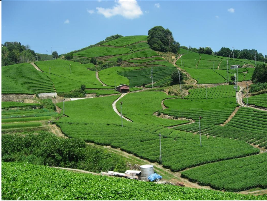
(石寺の茶畑 和束町)